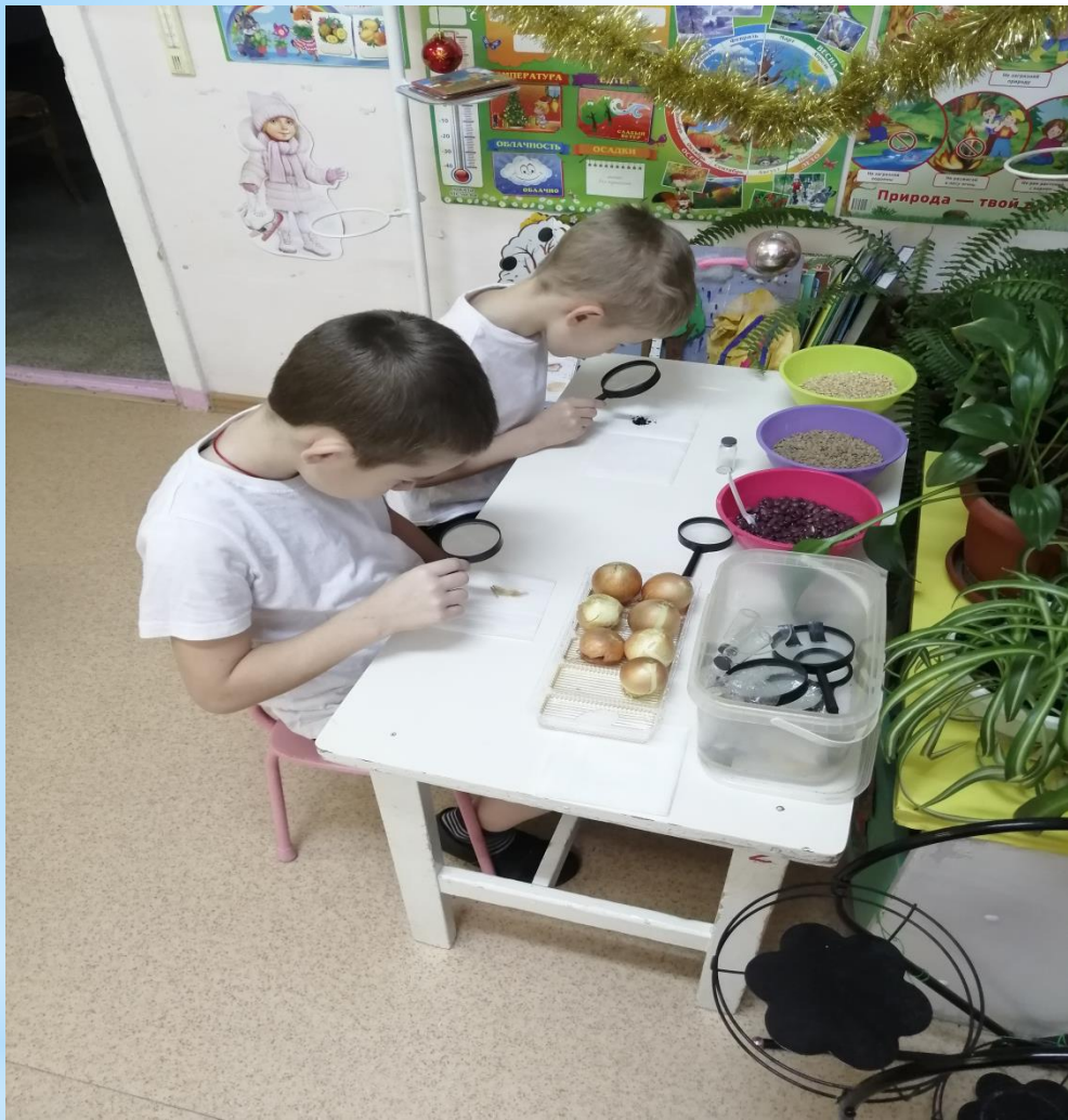
Рассматривание через лупу.