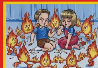
Не играй со спичками