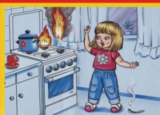
С плитой нужно быть осторожным!