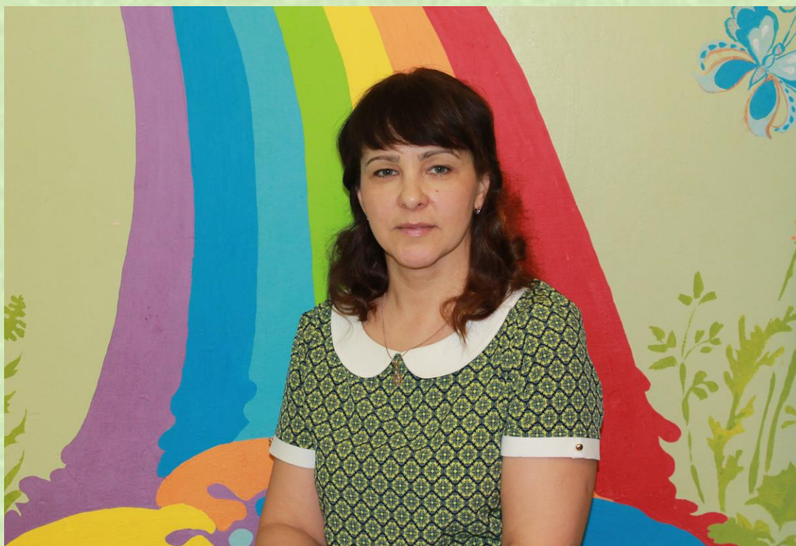
Автор :Вишнёва Жанна Викторовна Воспитатель 1 квалификационной категории